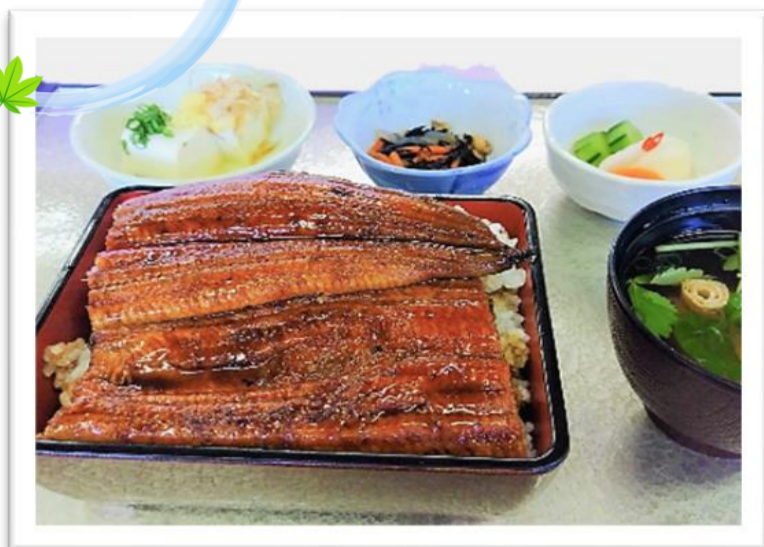
うな重 2,880円 (昼食付 プラス1,450円)