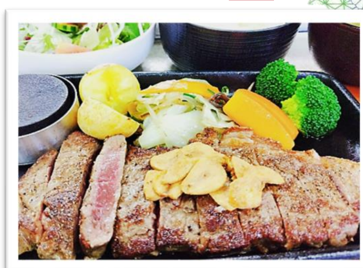
ステーキ膳 2,580円 (昼食付 プラス1,150円)