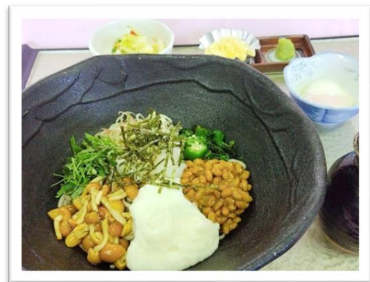
ねばトロ蕎麦 二八割 1,540円 (昼食付 プラス110円) 十割 1,760円 (昼食付 プラス330円)